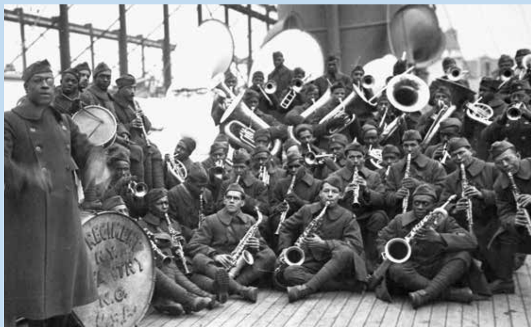
US NATIONAL ARCHIVES AND RECORDS ADMINISTRATION