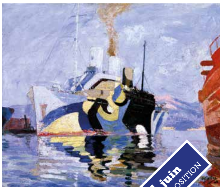
MUSEE NATIONAL DE LA MARINE - P. DANTEC

Musée national de la Marine 02 98 22 12 39 brest@musee-marine.fr www.musee-marine.fr • pas d'accès PMR tout public - De 13h30 h à 18h30 du 01/10 au 31/03 de 10h à 18h30 du 01/04 au 30/09