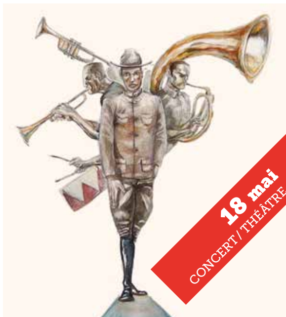
EMMANUELLE LE BLOAS

15 mai AU 31 août RÉSIDENTIE PUIS EXPOSITION