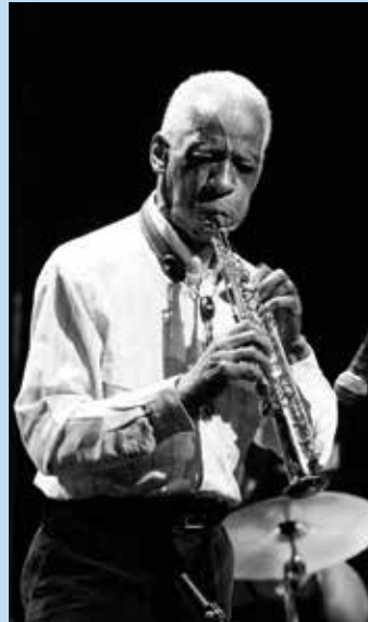
HERVÉ LE GALL - www.hervelegall.fr