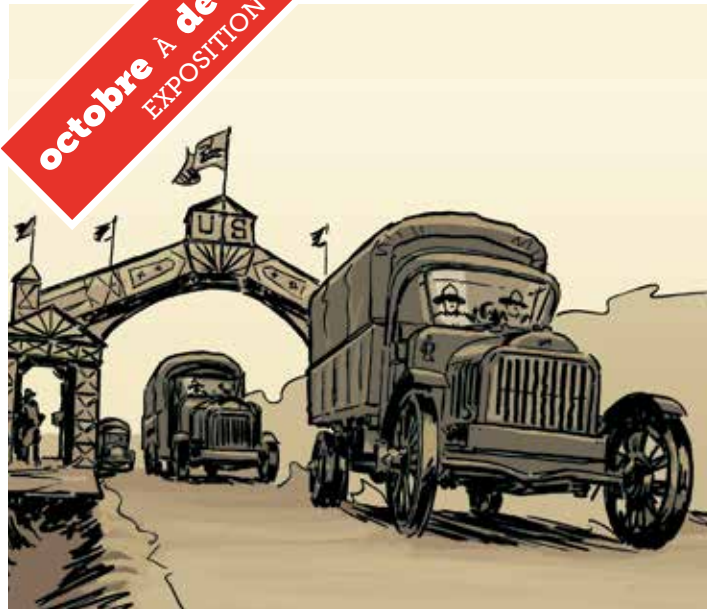
ERWAN LE BOT