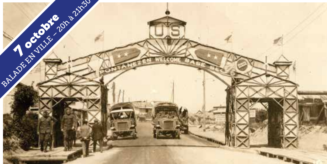
ARCHIVES MUNICIPALES DE BREST